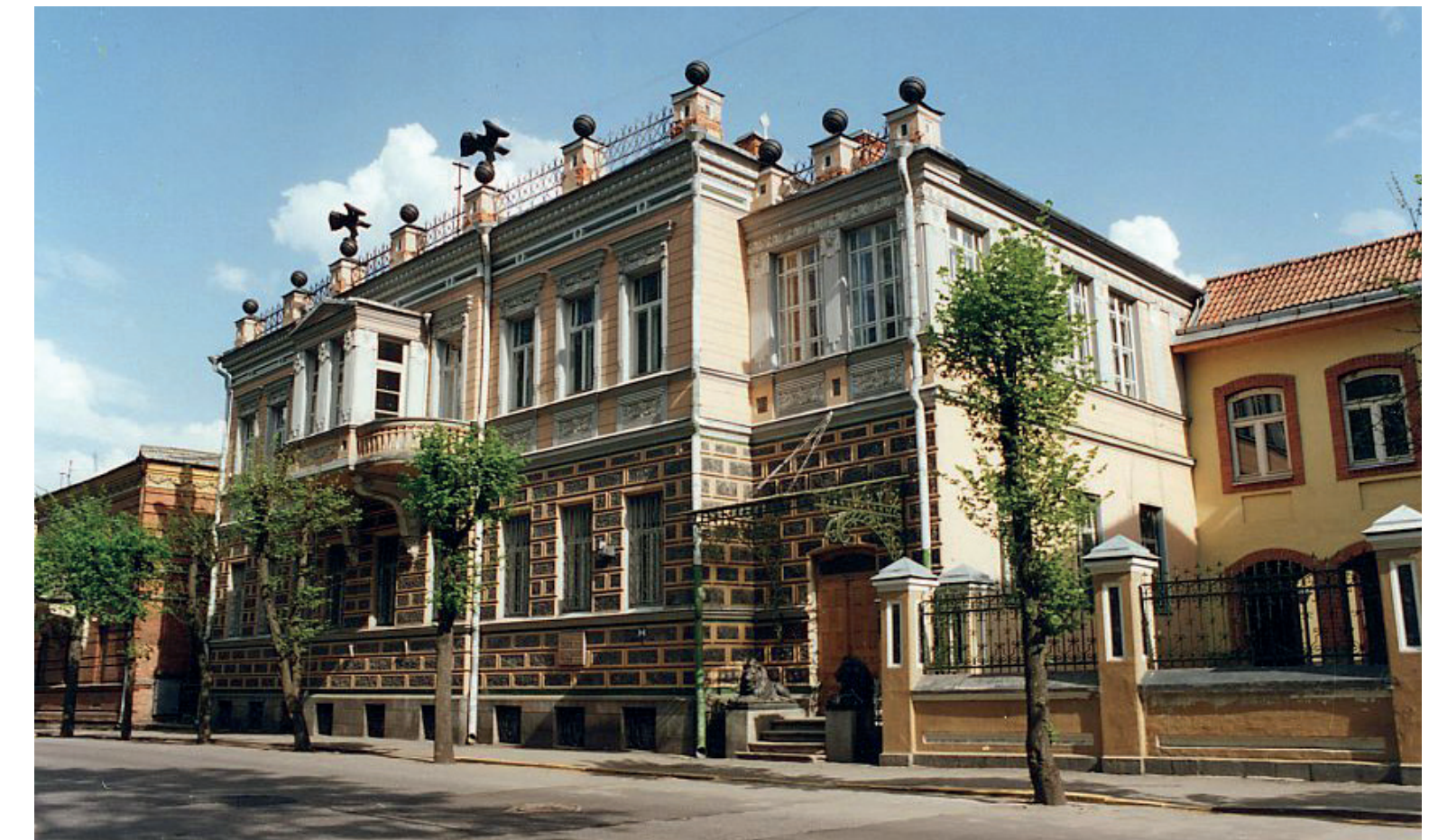
Daugavpils Novadpētniecības un mākslas muzejs 2000. gadi.