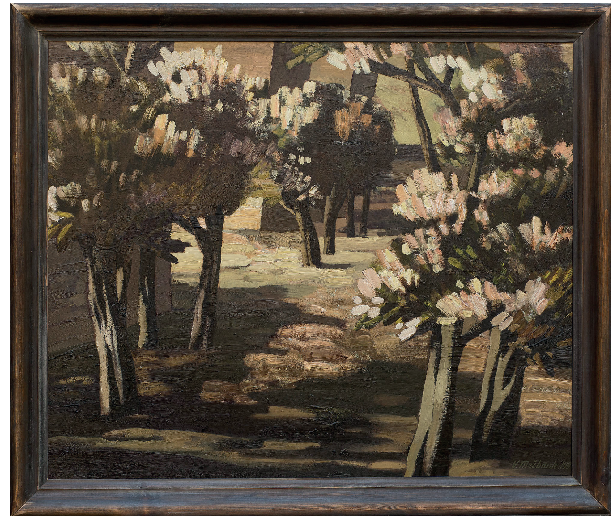
Valda Mežbārde. Kastaņu iela. 1994. Kartons, eļļa. 100 x 100 cm.

Sagatavots izdevuma manuskripts 150 lappuses (bez teksta tulkojuma uz angļu valdu), apkopoti rezultāti.