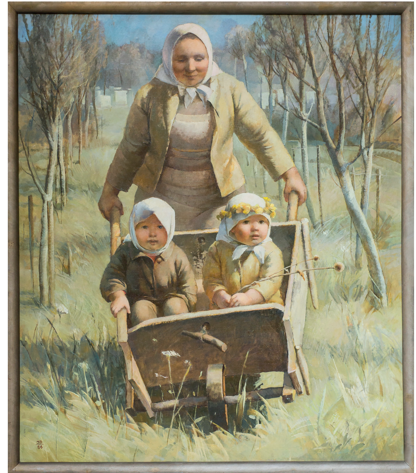
Inta Dobrāja. Lauku Madonna. 1986. Audekls, eļļa. 140 x 121 cm.

Aktualizēt zinātniski pētnieciskos un vizuāli informatīvos materiālus drukas formātā.