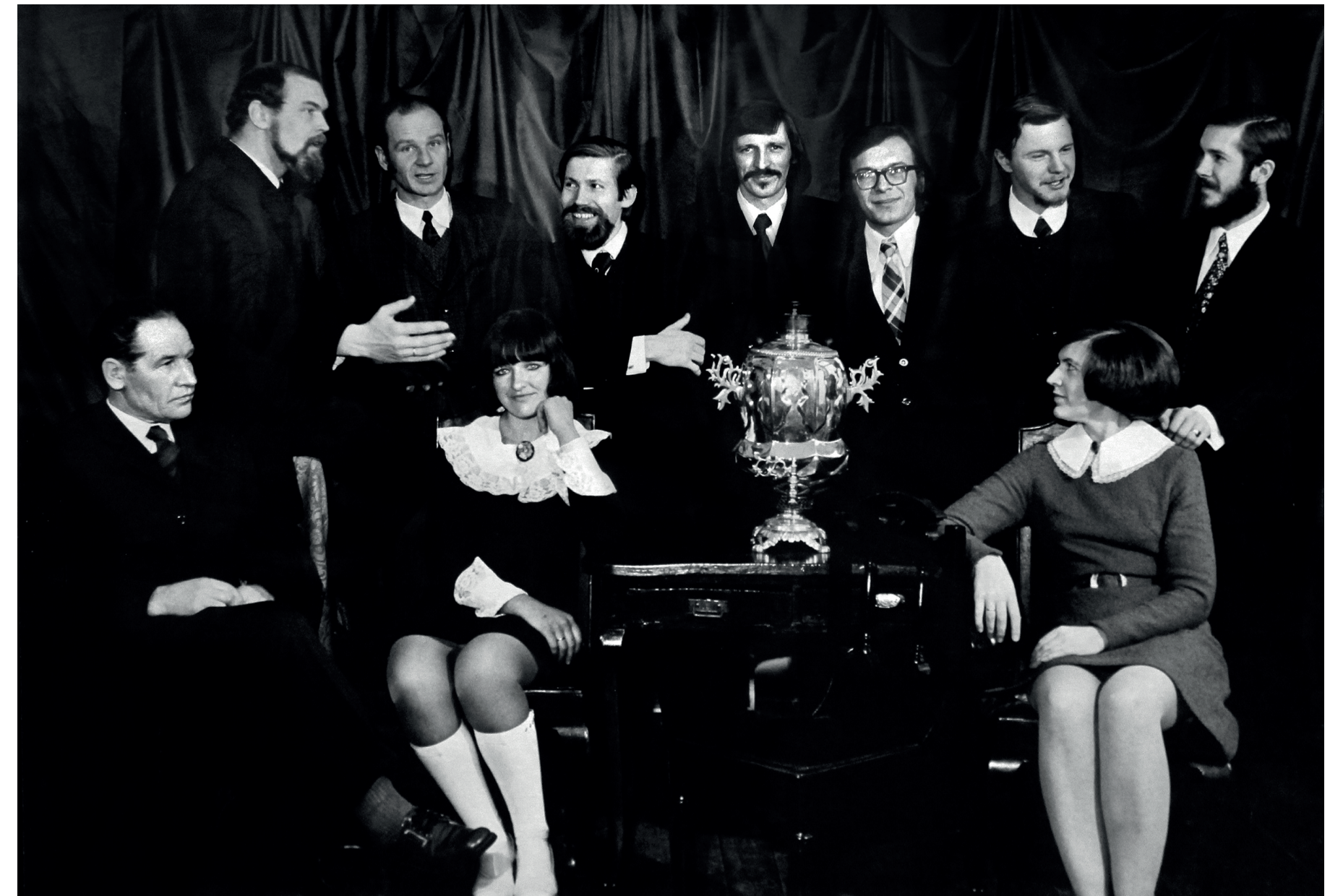
Daugavpils mākslinieku gupa. Foto Mečislavs Caune, 1976.

Izveidotas anotācijas par katru mākslinieku līdz 1500 rakstu zīmēm, kas ietver svarīgākos biogrāfijas datus, dzimšanas vietu, izglītību, nozīmīgākos darbus Daugavpilī. Materiālu sagatavoja Valda Mežbārde un Mairita Folkmane.